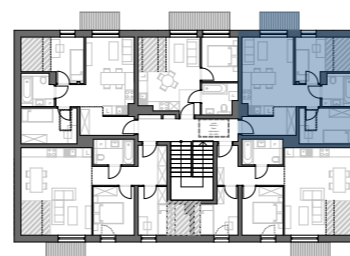
PLAN BUDYNKU NR 5