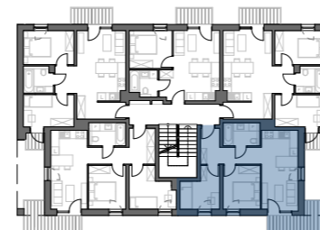
PLAN BUDYNKU NR 3