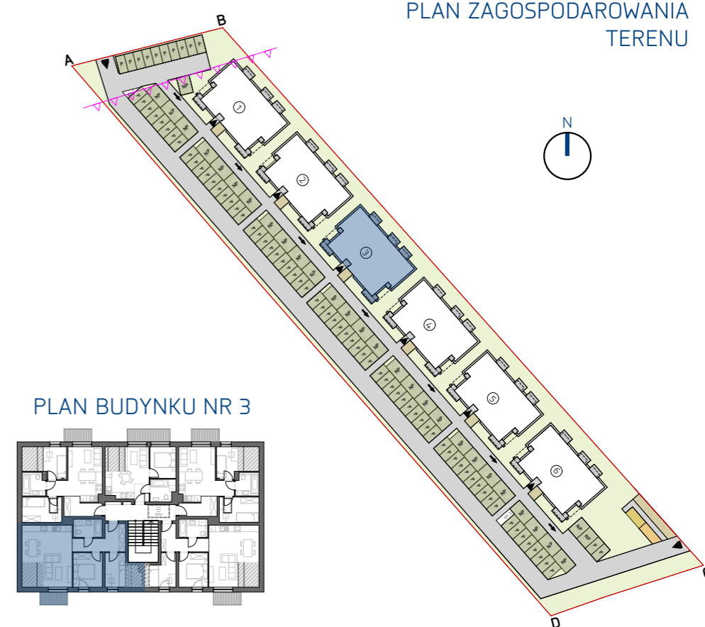
PLAN BUDYNKU NR 3