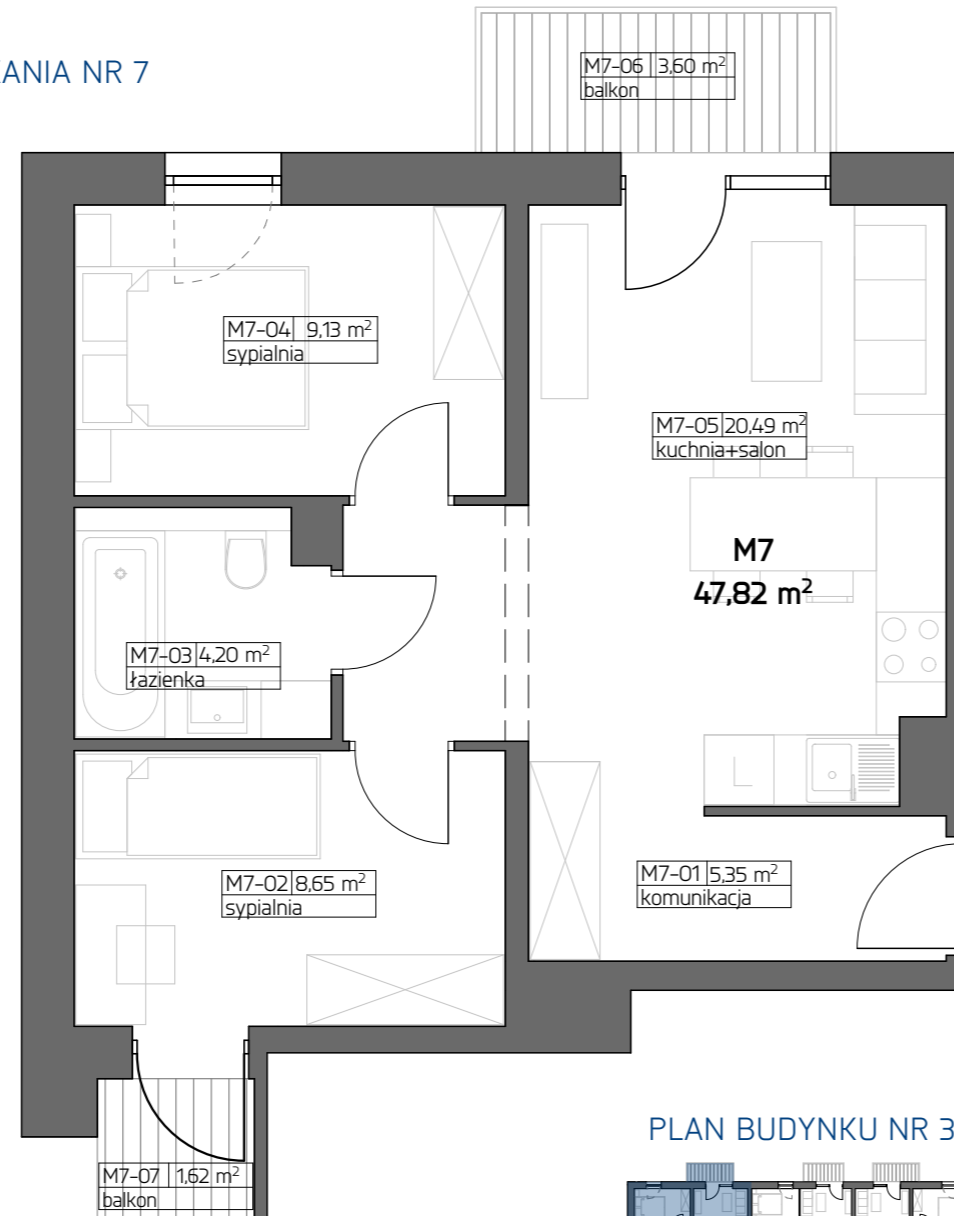
PLAN BUDYNKU NR 3