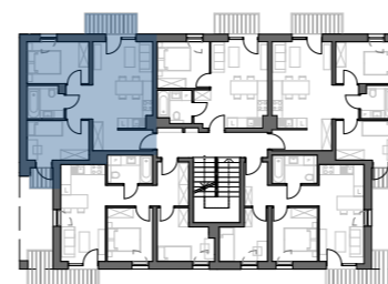
PLAN BUDYNKU NR 3